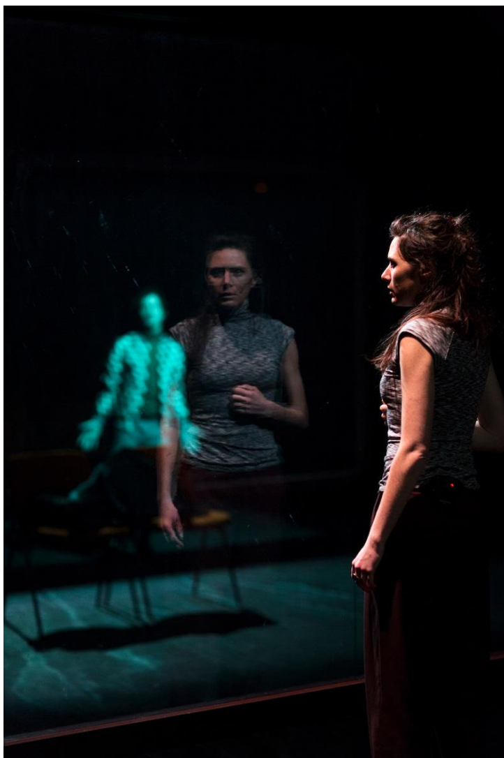
Summer Break

Possibilité de présenter les deux spectacles dans une même soirée (entracte de 30mn) ou séparément.