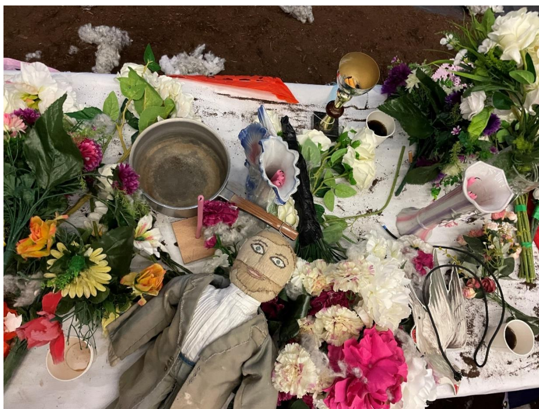
Recherches scénographiques © Louise